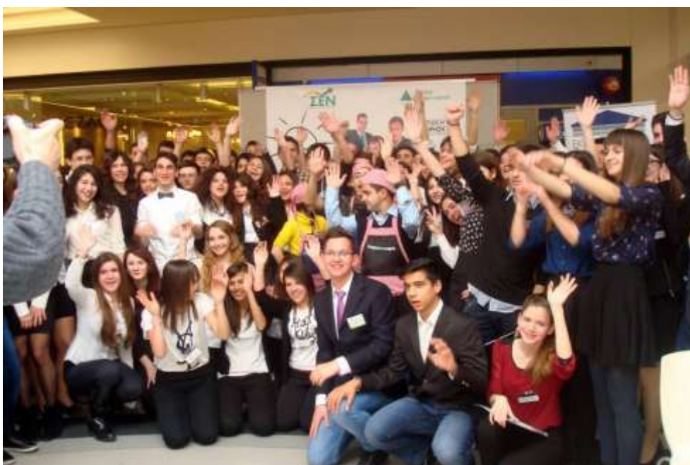
Οι μαθητές στην εμπορική έκθεση της Θεσσαλονίκης