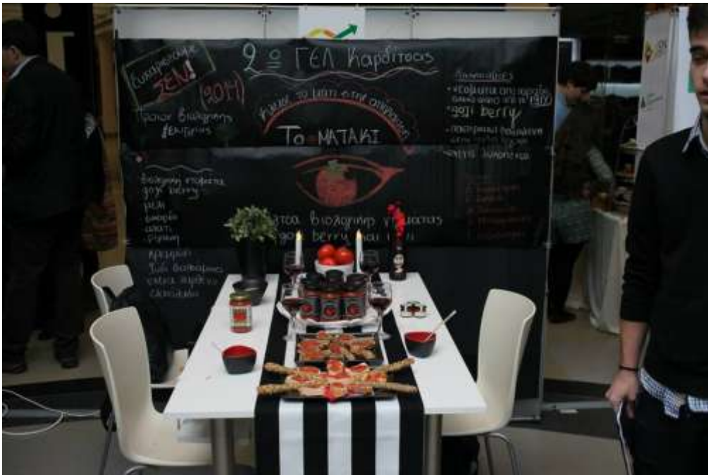
Το περίπτερο του 2ου ΓΕΛ Καρδίτσας