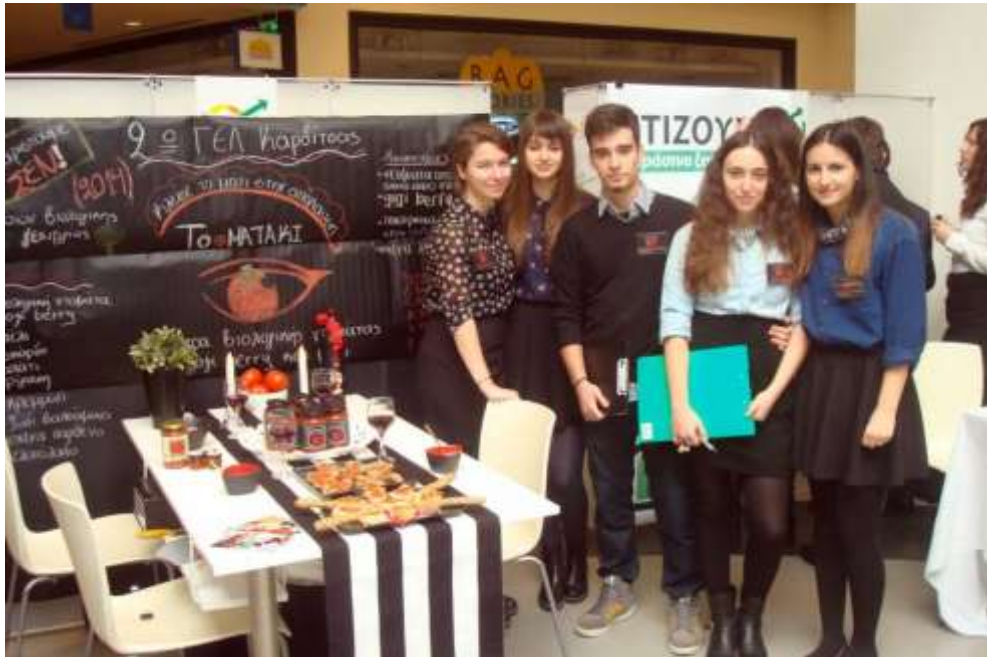
Η ομάδα του 2ου ΓΕΛ Καρδίτσας