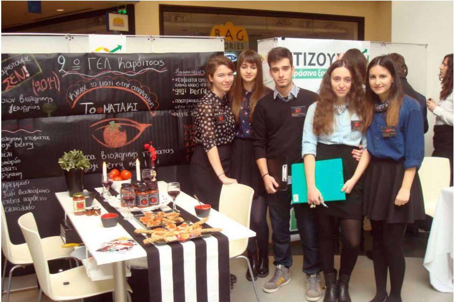
Η ομάδα του 2ου ΓΕΛ Καρδίτσας στην εμπορική έκθεση της Θεσσαλονίκης (2014)